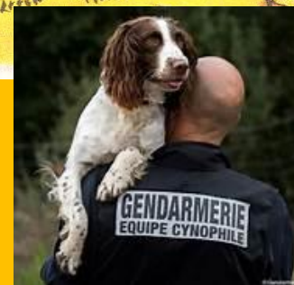
Démonstration équipe cynophile de la gendarmerie